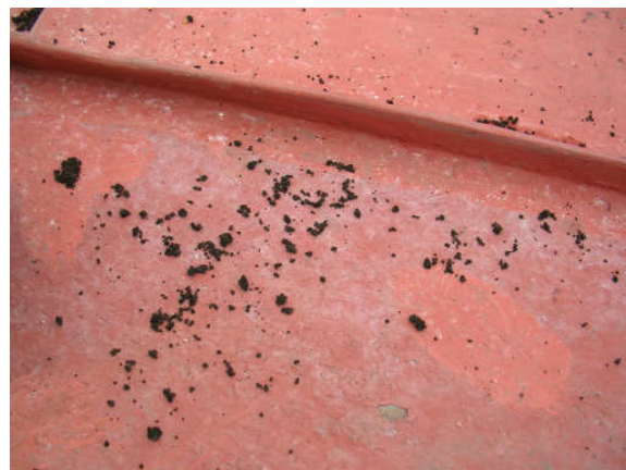
Saze ze spalování domovního odpadu