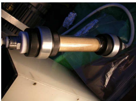
Měření SCCP (PUF)