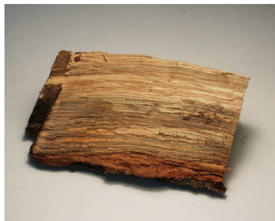
b) Palivové dřevo, dubová polena