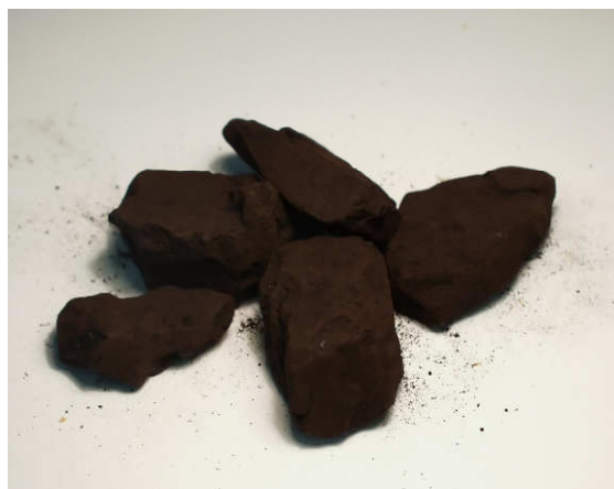
a) Hnědé uhlí, zrnitost 20 – 40 mm