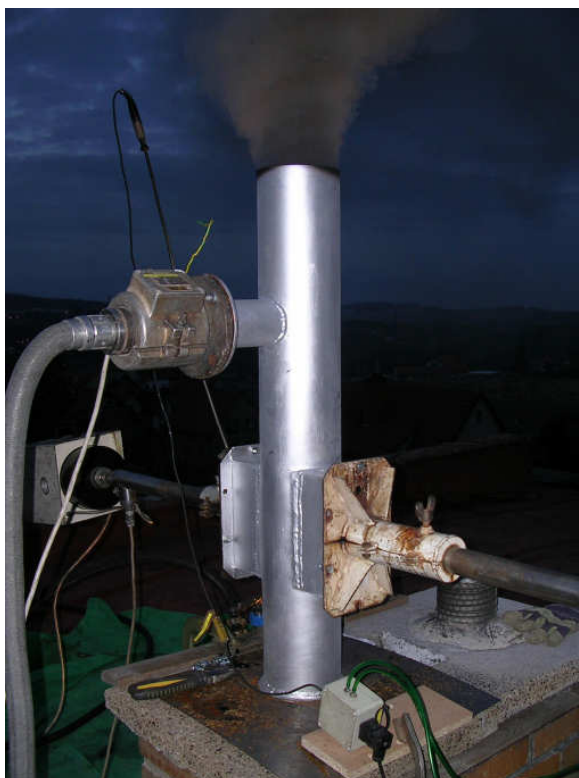
Měřicí místo splňuje požadavky norem ČSN ISO 10780 a ČSN ISO 9096