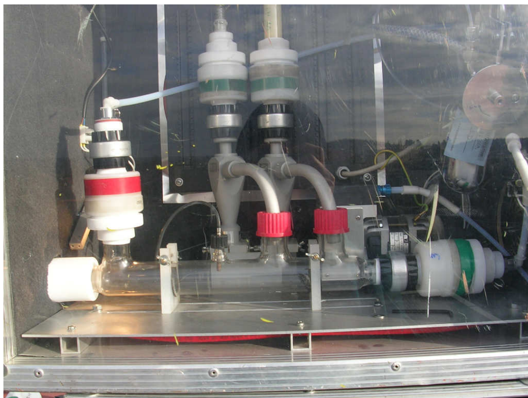
Detail aparatury VAPS