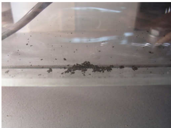
Pevné částice v manifoldu aparatury VAPS