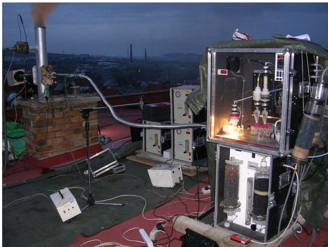
Měřicí aparatura VAPS