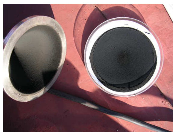
Filtr z externího zachycovače (měření TSP)